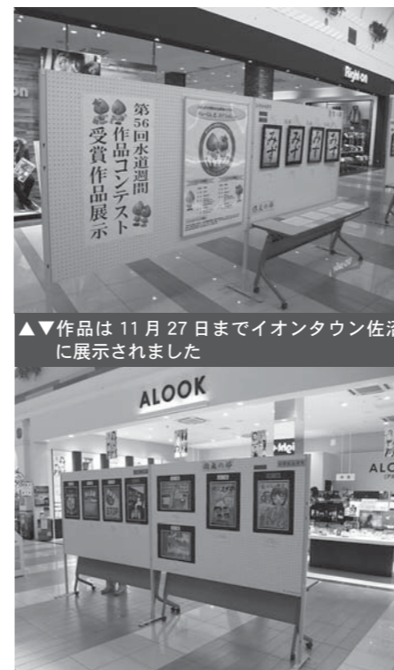
▲▼作品は11月27日までイオンタウン佐沼に展示されました