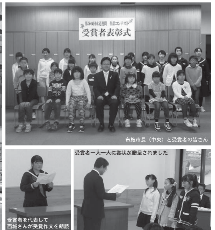
布施市長(中央)と受賞者の皆さん