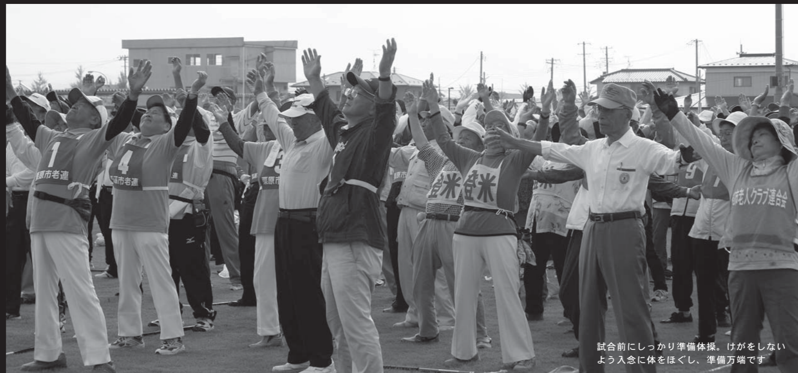
試合前にしっかり準備体操。けがをしないよう入念に体をほぐし、準備万端です