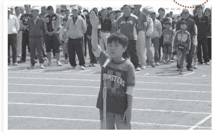
▲元気いっぱいの選手宣誓に大きな拍手が送られました