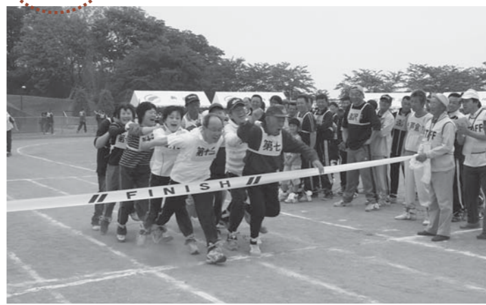
▲最初にゴールテープを切るのはどっち