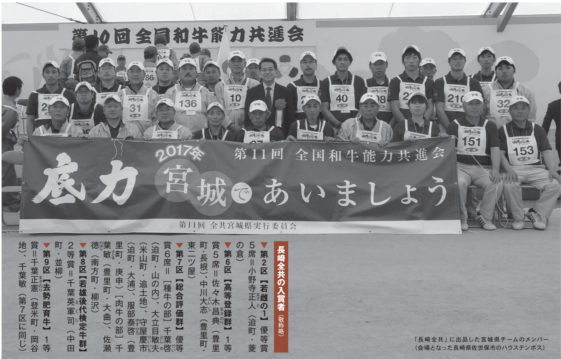
第11回 全共宮城県実行委員会