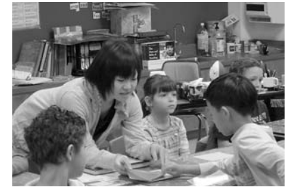
アメリカ United States of America

「登米市青少年海外派遣事業」は、市内の青少年の国際性を養い、広い視野に立った青少年を育成することを目的として行う事業です。平成22年度は中高生を対象にカナダ、オーストラリア、アメリカの3カ国で、ホームステイや現地の人々との交流などを中心としたプログラムを予定しています。