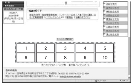
【図2】 ホームページ広告掲載イメージ

※枠内右上に「広告」と記載 【掲載期間】 5月1日号から 平成23年4月1日号まで （各月の1日号のみ全12号） （1カ月単位・複数月にわたる掲載も可能） 【掲載対象】 次の業種別禁止基準以外の企業や商店など ① 風俗営業等の規制および業務の適正化に関する法律に規定する風俗営業 ② 風俗営業に類似する業種 ③ 消費者金融業者