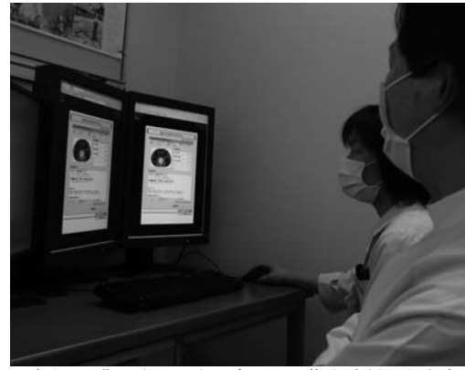
デジタル化によってより多くの画像を診断できます

市立病院では、佐沼・豊里両病院に導入し、佐沼病院では6月から稼働中で、豊里病院では22年3月からの稼働を予定しています。