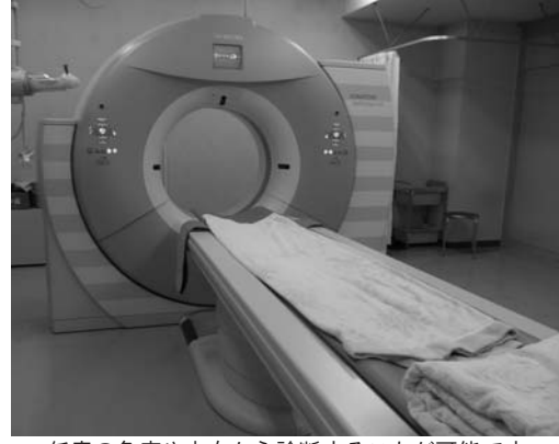
任意の角度や方向から診断することが可能です

ものに比べ、一度に多くの断面を撮影できるため、同じ範囲を短時間でより細かく、高画質で撮影することが可能となっています。