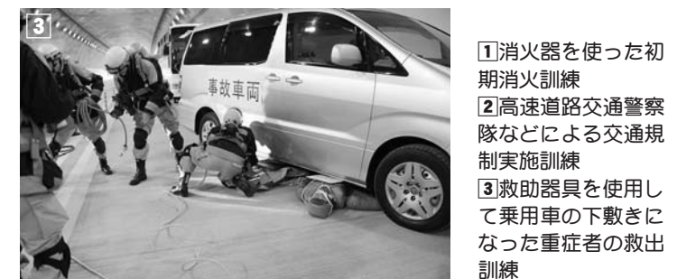
①消火器を使った初期消火訓練 ②高速道路交通警察隊などによる交通規制実施訓練 ③救助器具を使用して乗用車の下敷きになった重症者の救出訓練