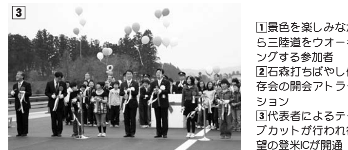
①景色を楽しみながら三陸道をウォーキングする参加者 ②石森打ちばやし保存会の開会アトラクション ③代表者によるテープカットが行われ、希望の登米ICが開通

開通前日の3月21日に、開通記念イベント「ハイウエーフリーウオーキング」が開催され、大勢の人が参加しました。コースは三陸道鴫波トンネルからスタートし、桃生津山ICまでの約3kmで、参加者は三陸道からの景色を楽しみながら歩いていました。