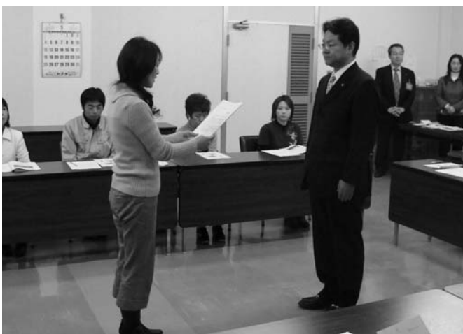
市民の目線でまちづくりを進めます「市民会議からの提言」

また、市有林の整備については、これまで進めてきた針葉樹中心の森林造成から、針葉樹・広葉樹の混交林化を図り、多面的機能の向上と四季の移り変わりを感じさせる自然豊かな市有林の造成を進めていきます。