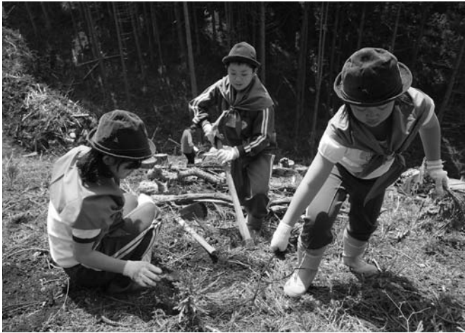
自然豊かな森林を作ります「市民参加の新たな森林づくり」

さらに、こうした市の取り組みの状況を電子情報媒体を活用して広く紹介し、市内物産品などのPRと販路拡大を進めていきます。