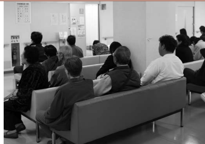
市民皆さんが安心して暮らせる医療体制を整備します

また、地域の皆さんが相互に結びつきを深めながら、地域の課題や問題の解決に向けて今後の行動計画などをまとめ、地域の将来のビジョンを作る、「市民が創る地域のまちづくり計画」の策定支援も引き続き行っていきます。