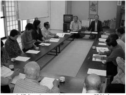
支援ネットワークについての懇談会

石越町在宅要支援者生活支援ネットワーク事業 石越町では、一人暮らしの高齢者を対象に、日常の比較的軽微な援助(声掛けや見回りなど)を、近隣住民ボランティアと福祉関係者が一体となって行う「在宅要支援者生活支援ネットワーク事業」が、市社会福祉協議会石越支所を中心に展開されています。