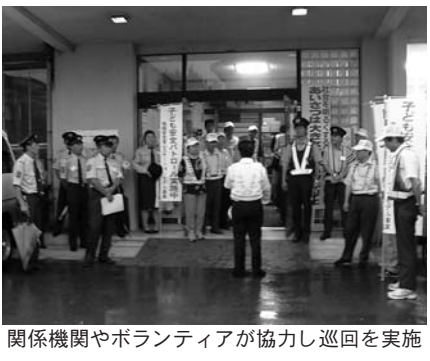
関係機関やボランティアが協力し巡回を実施

豊里町安全安心 防犯パトロール事業 豊里町では、地域の防犯意識の向上や非行防止などの子どもたちの健全育成、下校時の事件事故の発生を防ぐことを目的に、地区住民や関係機関が協力して「豊里地域安全安心防犯パトロール事業」を実施しています。