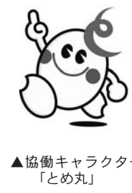
▲協働キャラクター「とめ丸」