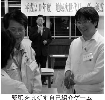
緊張をほぐす自己紹介ゲーム

地域を担う次世代リーダーの育成を目的に、平成20年度「地域次世代リーダー養成講座」の開講式ならびに2つの講座が9月27日に迫公民館を会場に開催されました。 第1回は「登米市の魅力とこれからのまちづくり」に関する2講座が開催され、布施市長との意見交換や「市総合