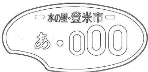
▲市民投票によって選ばれた「コメ型」ナンバープレート

希望ナンバー当選書と旧ナンバープレートを持参してください。ただし、11月28日までに交換、登録がない場合は当選を取り消します。