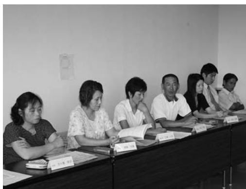
今後の活動について話し合われました

市長は「モニターの皆さんには、市政について感じたことなど、どんなことでもいいのでご意見をいただき、今後の市政運営に役立てていきたい」とあいさつしました。 今後は、会議の開催のほか、市政に対する要望や地域問題などの取り