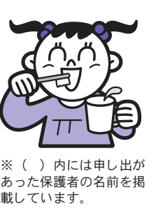
※( )内には申し出があった保護者の名前を掲載しています。