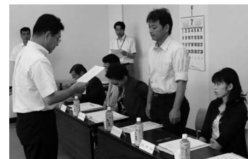
布施市長からモニターに委嘱状が交付されました

気付いたことなど、どんなことでもいいのでご意見をいただき、今後の市政運営に役立てていきたい」とあいさつしました。 意見交換では、医師不足などによる市立病院の診療休止・制限問題のほか、介護や子育て支援、農業振興、いじめ問題など、市政に対する意見や要望が出されました。 今後は、会議の開催のほか、市政に対する要望や地域問題などの取りまとめ・報告、アンケート調査への協力などを随時行っていく予定です。