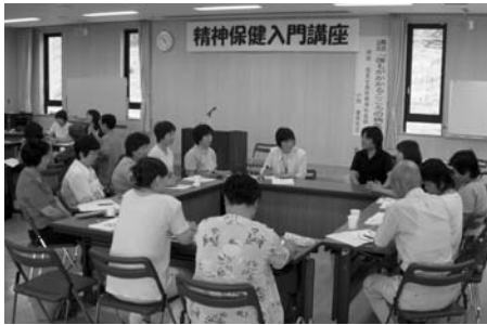
石越町で開催された精神保健入門講座