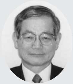
助役 井林 貢氏（仙台市）