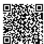
空き家改修事業補助金ページ QRコード

URL: https://www.city.tome.miyagi.jp/jyutakutoshi/shisejoho/ijuteju/bank/akiyakaisyu.html