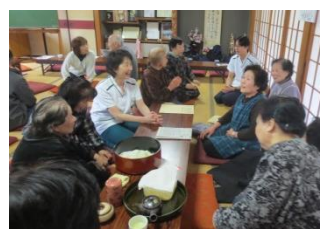
お茶っこ飲みをしながら 健康相談

気軽に相談等ができるかかりつけ医を持つこともお勧めします。病気やけがの治療はもちろんのこと、かかりつけ医に身体の不調等を早めに相談できれば、健康の維持や重症化の予防も期待でき、また医療機関の紹介もしてもらえます。