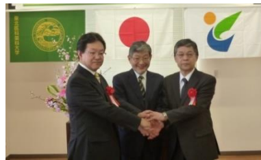
サテライトセンター開所式

将来的にサテライトセンターに常駐する教員の先生方には、学生の指導とともに、市民病院に常勤していただき、診療してもらう予定で、現在、非常勤医師として内科や整形外科に応援をもらっています。また、8年後には登米市でも実習をした地域卒の学生が、医師として勤務する予定です。