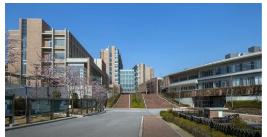
東北医科薬科大学 小松島キャンパス