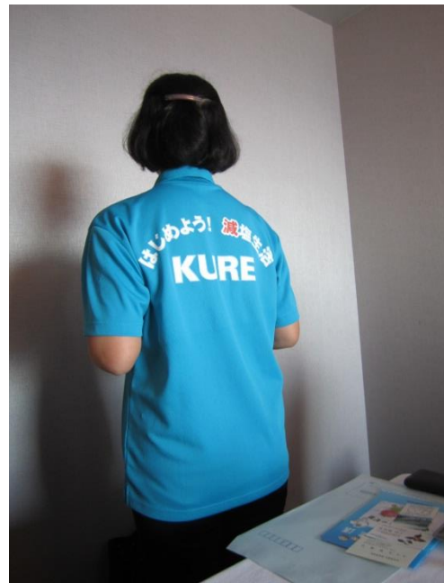
【減塩PR用のポロシャツ】