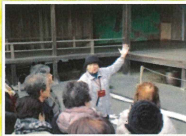
ベテランガイドさんの講習