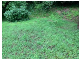
↑家庭菜園も やっていた敷地