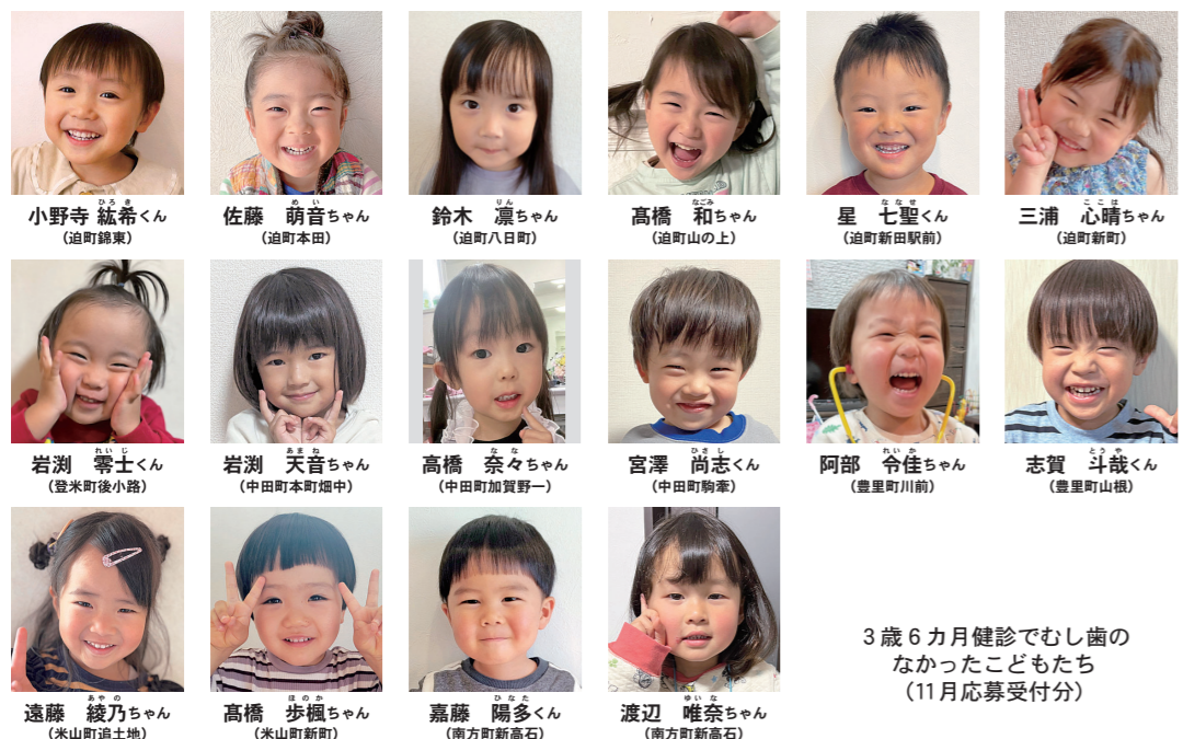
3歳6カ月健診でむし歯のなかったこどもたち(11月応募受付分)

30分~午後4時(1人約50分) 【相談員】NPO法人ハーティ 仙台女性相談員 【申込期限】1月16日(火)午後3時(匿名可、託児不可) ●共通事項 ☎ 02220(22)6118