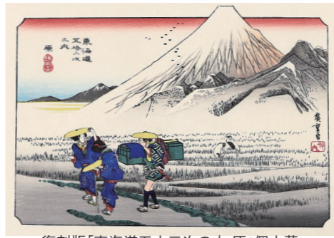
複製版「東海道五十三次の内 原」個人蔵

登米懐古館で、企画展「旅して広重・奇才北斎、どきどき歌麿。」を開催します。登米伊達家家臣・旧亀井家コレクションの中から、昭和30～40年代