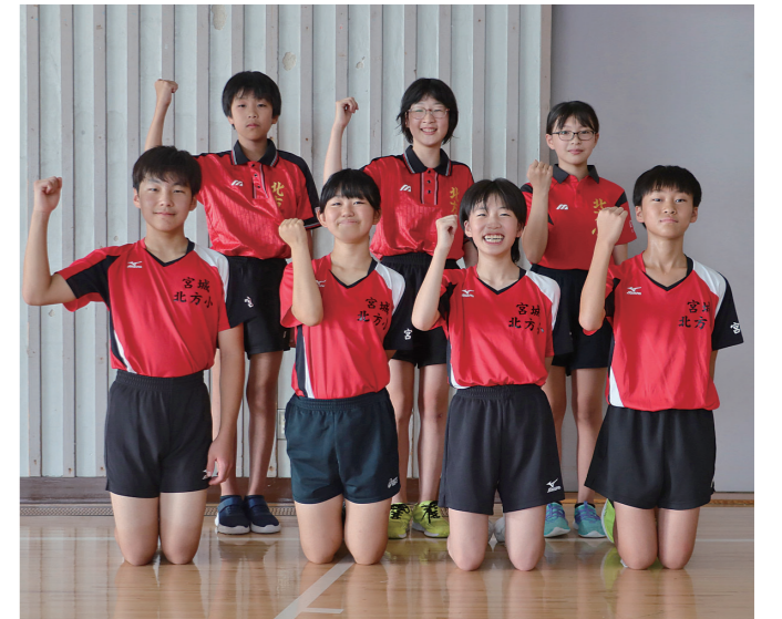
第55回交通安全こども自転車全国大会出場

目標に掲げていたベスト16に入ることができてうれしかったです。今回の大会で見つかった課題を克服し、冬の大会では、より良い成績を残せるようにこれからも練習に励んでいきます。