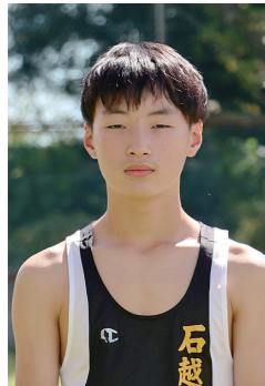
第39回全国小学生陸上競技交流大会5年男子100m出場

全国には、強い人がたくさんいると感じ、悔しかったです。来年は入賞できるように頑張っって練習に励んでいきます。