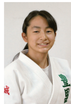
第54回全国中学校柔道大会女子個人出場

コーチやたくさんの人に支えられたおかげでベストを尽くすことができました。コーチからいただいた言葉を胸に努力を続けます。