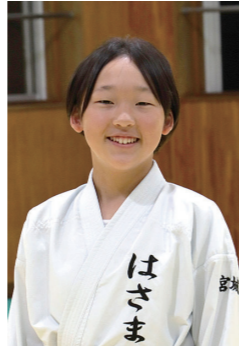
第23回全日本少年少女空手道選手権大会出場

会場の雰囲気緊張しましたが、最後まで勝ちたいという気持ちを切らさずに試合をすることができました。