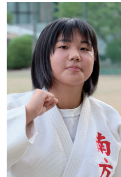
第54回全国中学校柔道大会女子個人出場

14位と悔しい結果に終わってしまいましたが、これからも心身を鍛えて、全国入賞を目指して挑戦します。