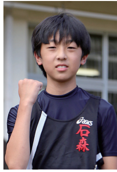
第39回全国小学生陸上競技交流大会男子コンバインドA出場