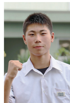
第50回全日本中学校陸上競技選手権大会男子四種競技出場

3分間戦い切ることができて良かったです。これからも練習を積み重ね、成長した試合ができるようにしたいです。