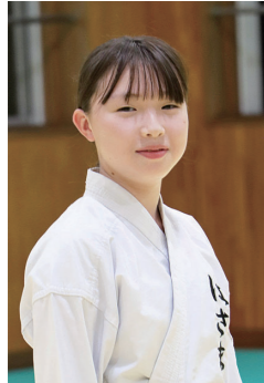
第23回全日本少年少女空手道選手権大会出場

全国のレベルの高さに圧倒されてしまいました。中学ではさらに良い結果を残せるよう、練習を続けたいです。