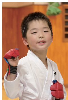
第23回全日本少年少女空手道選手権大会出場

結果はベスト16でした。もっともっと勝ちたいと思ったので、気持ちを鍛えて、みんながびっくりする強い選手になりたいです。