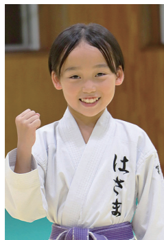
第23回全日本少年少女空手道選手権大会出場

会場の日産スタジアムの大きさに緊張しましたが、13秒台を記録できたので結果に満足しています。次は、12秒台を出したいです。