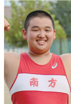
第50回全日本中学校陸上競技選手権大会男子砲丸投げ出場