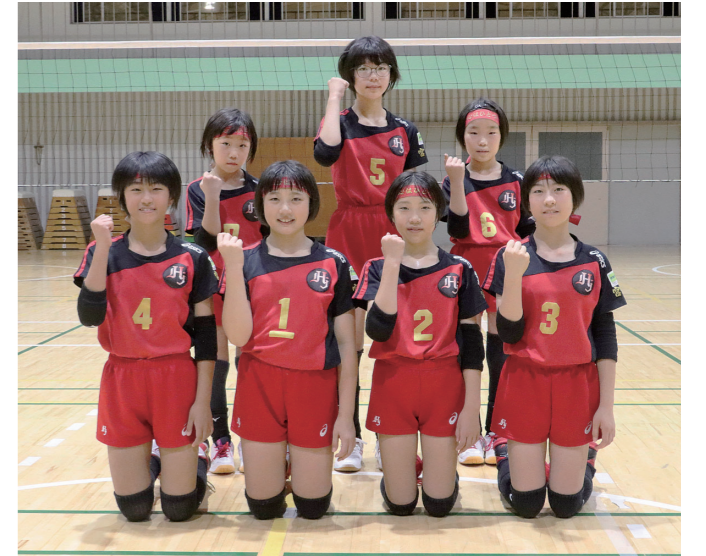
第43回全日本バレーボール小学生大会出場

2回戦は気持ちが落ち着かず頭が真っ白になってしまいました。今後は気持ちで勝つことを意識して試合に挑みたいです。