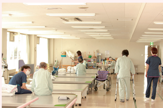
リハビリテーション室の様子

ビリをしてもらうなど、「してもらおう」というイメージがあるかと思いますが。しかし、退院後も自分で行けるリハビリを継続することで、さらなる機能改善、能力改善が期待できます。ここで大切なことは「してもらおう」から「自ら行う」に気持ちを切り替えていくことだと思います。気持ちの切り替えが円滑にいくように、入院中から退院後を見据えて、自主訓練などを含めたリハビリを丁寧に提供していきます。