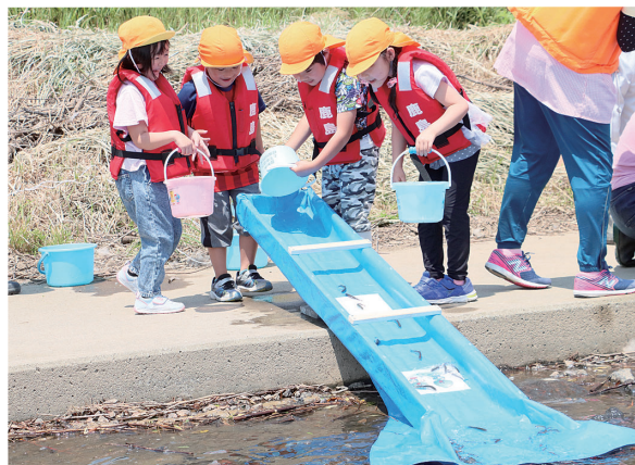
園児たちは、放流後に元気に水の中を泳ぎ出したヤマメの稚魚を見て目を輝かせていました。

稚魚の放流事業は、1988(昭和63)年から始まり、今年で34回目。北上川の豊かな自然環境と水資源を受け継ぎ、次代を担うこどもたちに水の大切さを伝えるため、水道週間行事の一環として実施しています。参加した園児たちは、バケツに入った3から5センチほどの大きさの稚魚を川へ続くスライダーへ放流し、「大きくなあれ」とヤマメの成長を願いながら送り出しました。