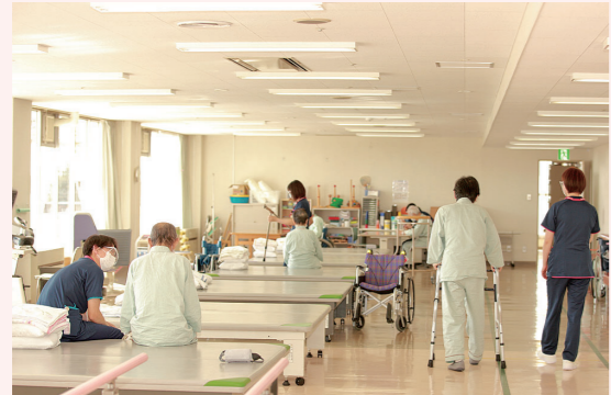
リハビリテーション室の様子

ビリをしてもらうなど、「してもらう」というイメージがあるかと思いますが、しかし、退院後も自分でできるリハビリを継続することで、さらなる機能改善、能力改善が期待できます。ここで大切なことは「してもらう」から「自ら行う」に気持ちを切り替えていくことだと思います。気持ちの切り替えが円滑にいくように、入院中から退院後を見据えて、自主訓練などを含めたリハビリを丁寧に提供していきます。