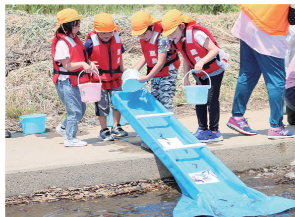
園児たちは、放流後に元気に水の中を泳ぎ出したヤマメの稚魚を見て目を輝かせていました。

稚魚の放流事業は、1988(昭和63)年から始まり、今年で34回目。北上川の豊かな自然環境と水資源を受け継ぎ、次代を担うこどもたちに水の大切さを伝えるため、水道週間行事の一環として実施しています。参加した園児たちは、バケツに入った3から5センチほどの大きさの稚魚を川へ続くスライダーへ放流し、「大きくなあれ」とヤマメの成長を願いながら送り出しました。