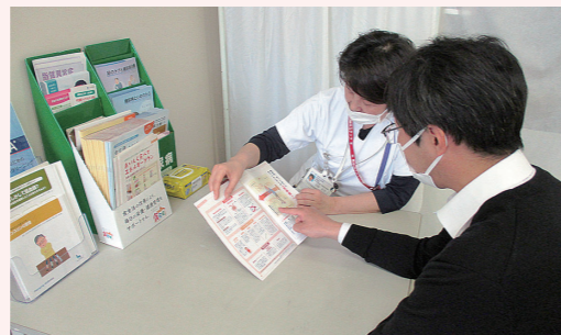
糖尿病認定特定看護師による日常生活における食事指導