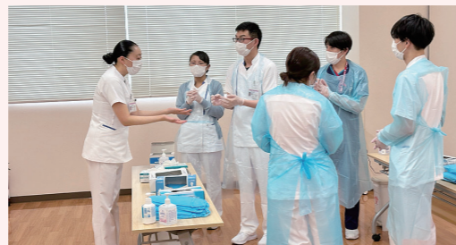
感染予防を徹底するため、感染管理認定看護師による職員を対象にした防護具着脱研修