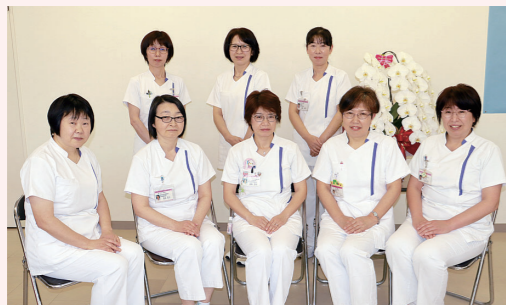
各施設の看護管理者