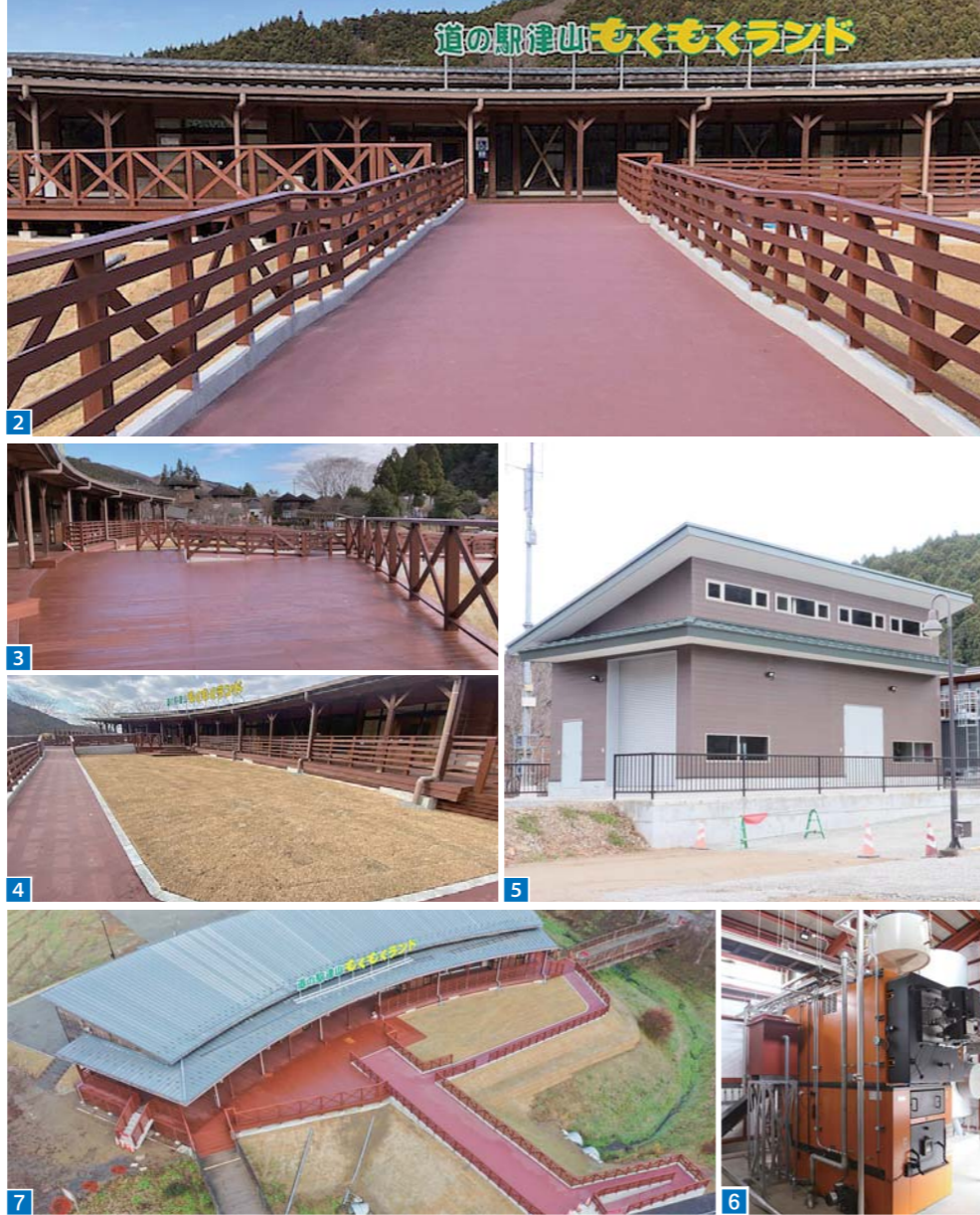
1 かさ上げ、外構などの工事後の外観 2 3 大型ウッドデッキと中央からのアプローチ 4 増設された広場とスロープ 5 6 木質バイオマスボイラーの建屋と本体 7 もくもくランド全景

令和元年の被害を今でも思い出します。荒れ果てた店内を見た時には、復旧できるのかスタッフ全員が不安を抱きました。そんな中、多くのボランティアが駆けつけてくださり、敷地内や店舗内の清掃などに力を貸していただきました。たくさんの協力、支援をいただいたことを今でも感謝しています。もくもくランドのリニューアルオープンには、私たちスタッフだけでなく、地域の皆さんの願いでもあります。新しくなった道の駅とともに、津山地域だけにとどまらず、登米市全体を盛り上げていきたいですね。