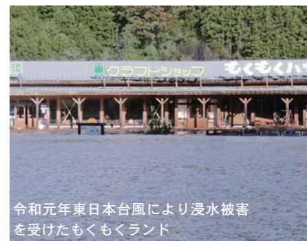
令和元年東日本台風により浸水被害を受けたもくもくランド