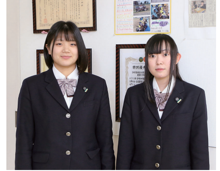
第69回全国高等学校ビジネス計算競技大会珠算・電卓競技出場

つらい練習を一緒に乗り越えてきた結束力は、どのチームに負けません。私たちの活躍を知ってもらい、ボートに少しでも興味を持ってもらえたらうれしいです。