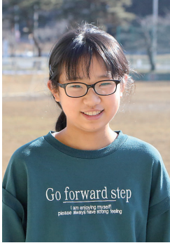
第66回JA共済全国小・中学生書道コンクール半紙の部銅賞