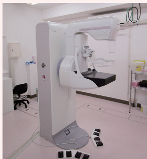
【マンモグラフィ装置】乳腺などの微細な病変を検出できる装置です。当院では、最新の機器により撮影した画像を用いて、専門医の適切な診断・治療につなげています