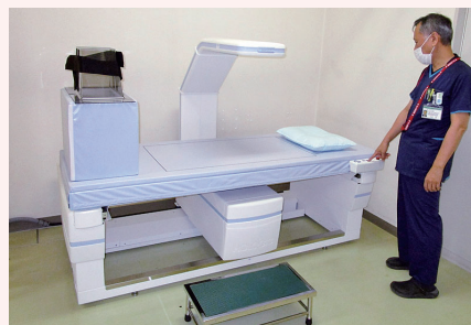
【骨塩定量検査装置】わずかなエックス線を用いて骨密度を測定し、骨粗しょう症などの状態を測定します