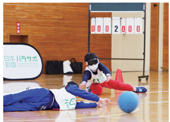
パラスポーツを通じて楽しみながら障がいということに触れ、自分が明日からできることを考えるきっかけになりました。

授業はパラスポーツの体験やパラアスリートの講話を通じて障がいに対する理解を深め、自分に何ができるか考える機会とするのが目的。児童は「目隠しをしたら暗くて怖かったので、障がいがあるのは大変なことだと分かりました。みんな平等に仲良くしていけるといいと思います」と話しました。