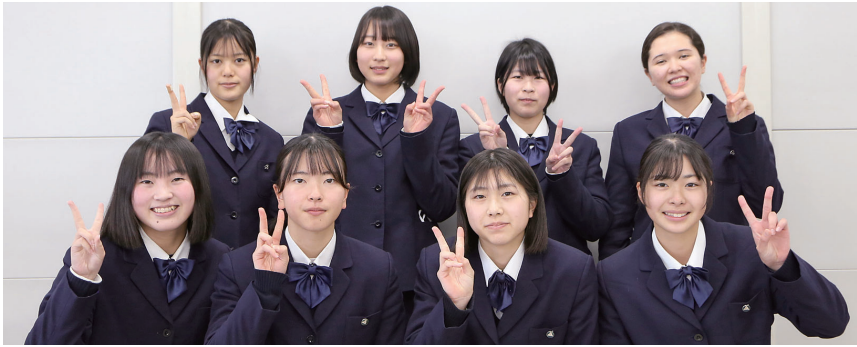
第77回国民体育大会ボート競技少年女子ダブルスカル出場・少年女子舵手付クォドルプル6位、第34回全国高等学校選抜ボート大会女子舵手付クォドルプル出場