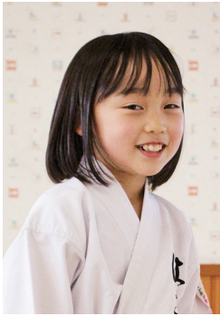
第22回全日本少年少女空手道選手権大会出場、第2回全日本少年少女空手道選抜大会