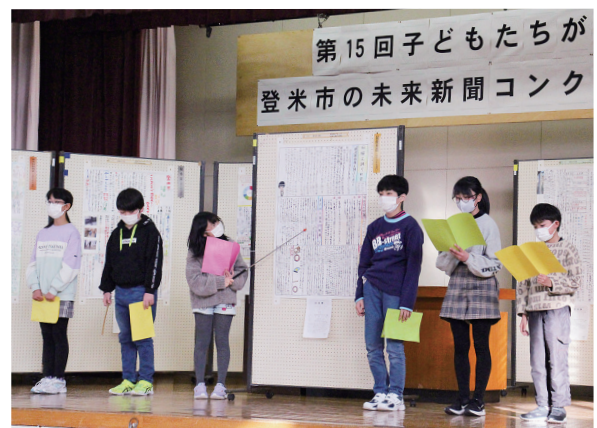
小学5年生部門最優秀賞の米川小の皆さん。「大好きな地元の伝統芸能を広く伝えたい」という思いを込めて新聞を作りました。

新聞は、自然、農業、食、伝統文化などさまざまなテーマで制作。細やかな情報と自由なアイデアがあふれる素晴らしい作品がそろいました。最優秀賞を受賞した新田小6年の皆さんは、新田駅の歴史や課題、未来へ向けての提案などを1枚の新聞にまとめ、ステージ発表では「私たちの考えた提案が実現して、活気があふれ、人のつながりを感じられる地域になってほしい」と話しました。