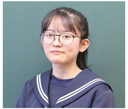
第70回全国小中高児童生徒川開書道展文部科学大臣賞