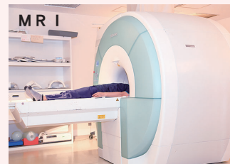
【CT装置とMRI装置】形は似ていますが、CTはエックス線、MRIは磁力と電波を用いて撮影します。それぞれの長所を生かし、撮影する機器を選択しています