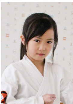
第60回全国防具付空手道選手権大会小学1年女子組手3位

全国大会を想定して繰り返し練習をしてきました。これからも目標に向かい、努力を惜しまず成長していきたいです。