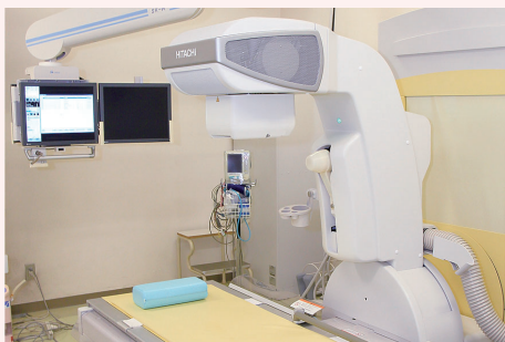
【エックス線TV装置】エックス線を使って、目的部位を直接観察しながら、検査・治療を行うことができます