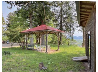
自動販売機設置予定地