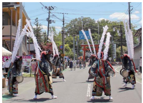
この日、市内は気温が35℃を超える猛暑日となったものの、会場を訪れた人たちは久しぶりの祭りを楽しんでいました。

コロナ禍により中止が続いていましたが、3年ぶりの開催となった佐沼夏祭り。例年と比べ大幅に規模を縮小して行われました。アルコール消毒などの感染症対策を施した飲食ブースには、焼き鳥やかき氷など、お祭りの雰囲気盛り上げる屋台が出店。郷土芸能佐沼鹿踊奉納や佐沼音頭による手踊り大行進などが、集まった観客を沸かせました。午後7時からは祭りのフィナーレを飾る約2,500発の花火が打ち上げられ、夏の夜空を鮮やかに彩りました。