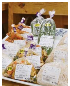
切りごぼうや手作りの漬物は1年を通して人気商品