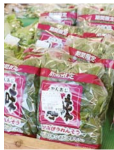
おひたしや炒めものにも人気のチチモホウレンソウ

地場産野菜は手頃な値段で好評です。旬の野菜を使ったレシピを設置していますので食材選びの参考にご覧ください。