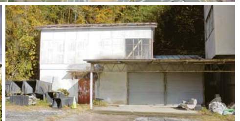
上:全体写真、左下:①旧東和公民館、右下:②車庫・⑤書庫B