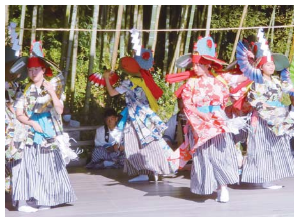
伝統芸能体験会に参加し華麗な「鶏舞」を舞う、登米中学校の生徒たち。

体験会は、登米町の伝統芸能3団体が、担い手不足で伝承危機にある伝統芸能を体験してもらうことで興味を持ってもらい後継者発掘につなげたいと企画。とよま山車祭り保存会により7曲のお囃子と祭礼の歌「とよま木遣り」が、岡谷地南部神楽保存会により「鶏舞」などが、登米謡曲会により演目「猩猩」が公演されました。森舞台は光に照らされ幻想的な雰囲気観客を魅了。その後、3会場で体験会が実施されました。