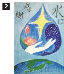
1 小学生低学年の部／櫻井美月（登米小）2 図画小学生高学年の部／高田一成（佐沼小）3 図画中学生の部／木村莉緒（登米中）4 習字小学生低学年の部／須藤未帆（米川小）5 習字小学生高学年の部／千葉彩香（佐沼小）6 熊谷盛廣市長と審査員、受賞者の皆さん7 厚生労働大臣賞を受賞した鈴木怜奈さん（米山中）