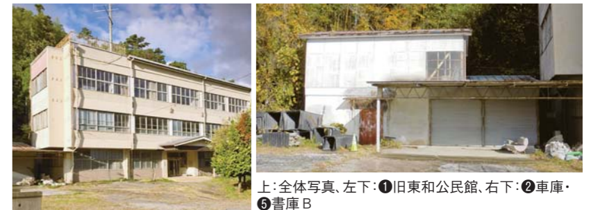
上:全体写真、左下:①旧東和公民館、右下:②車庫・⑤書庫B