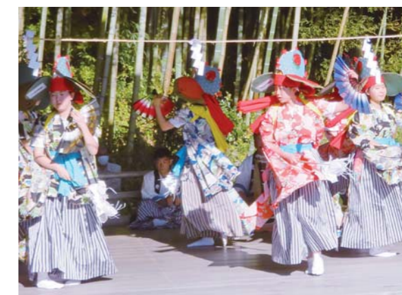
伝統芸能体験会に参加し華麗な「鶏舞」を舞う、登米中学校の生徒たち。

体験会は、登米町の伝統芸能3団体が、担い手不足で伝承危機にある伝統芸能を体験してもらうことで興味を持ってもらい後継者発掘につなげたいと企画。とよま山車祭り保存会により7曲のお囃子と祭礼の歌「とよま木遣り」が、岡谷地南部神楽保存会により「鶏舞」などが、登米謡曲会により演目「猩猩」が公演されました。森舞台は光に照らされ幻想的な雰囲気観客を魅了。その後、3会場で体験会が実施されました。