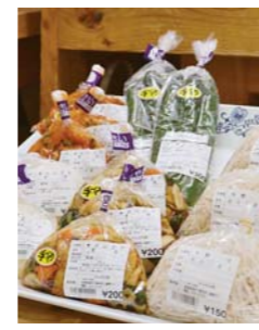
切りごぼうや手作りの漬物は1年を通して人気商品

味が良く値段が手頃」だと、市内だけでなく市外からのリピーターも多いです。 その他には切りゴボウや落花生が人気です。切りゴボウは、ふんわりした細目の千切りでシャキシャキとした歯ごたえ。ニンジンと合わせたキンピラやこれからの季節は雑煮の具材として人気があります。地元産落花生はとてもおいしいとファンの多い商品です。年末年始の定番商品です。 今後求めやすい価格で旬の物を販売していきますので、ぜひご来店ください。