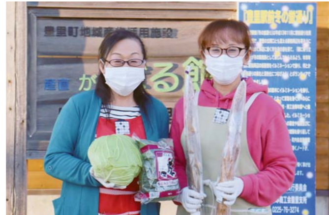
地場産野菜は手頃な値段で好評です。旬の野菜を使ったレシピを設置していますので食材選びの参考にご覧ください。