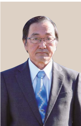
米川の水かぶり保存会