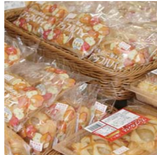
リンゴのうま味と甘味が凝縮され、パイ生地はサクサク(1パック324円)

食べられるパンタイプにしてるので、リピーターが多い商品です。ヨーグルトやジャムと一緒に食べると、また違った味わい方を楽しめます。 Q これから開催するイベントなどを教えてください 9月に入ると野菜、リンゴ、果物類、キノコ類と商品棚が品数豊富になります。 施設内は感染対策を施しています。自然に癒しを求めて、お立ち寄りいただければ幸いです。 【問い合わせ】道の駅「三滝堂」 0220(23)7891