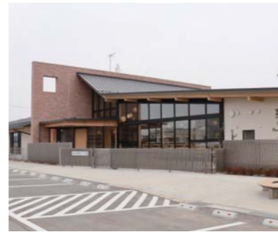
令和3年4月1日に開園した「豊里こども園」

【申込方法】申込書などの必要書類を、1号認定を希望する人は入園希望施設に、2、3号認定を希望する人は各総合支所市民課(市民係)に提出してください