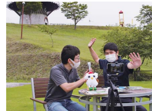
市観光シティプロモーション課の職員と地域おこし協力隊員が、ライブ配信で登米市の魅力をPRしました。

登米市は、長沼ボート場クラブハウスから長沼フートピア公園の風車を背景に中継。イベントでは、4市町別にクイズを出題し、正解者には抽選で地元の特産品「伊豆沼農産の3種のウインナーとミートケーキ・リングフランク詰合せ」をプレゼントしました。