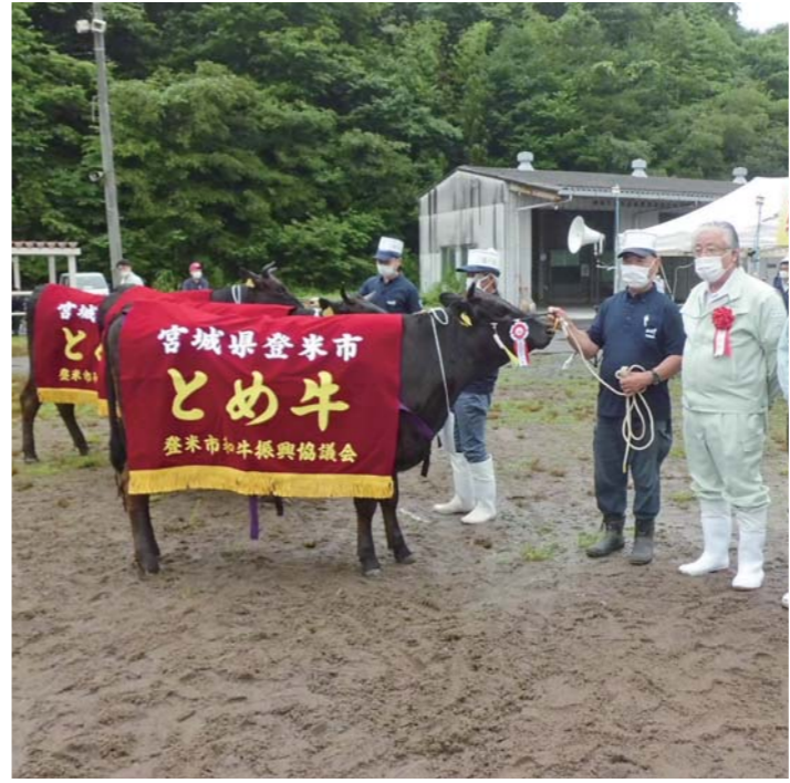
■チャンピオン賞/石越町和牛改良組合

市畜産共進会が7月8日、南方農畜産物集出荷場で開かれました。 共進会は、地域の畜産改良意欲の高揚や、飼養管理技術の向上と普及に努めることを目的に毎年開催しています。今年の共進会には、延べ52頭が出品。上位入賞牛は県共進会の出品牛候補になります。結果は次の通り。