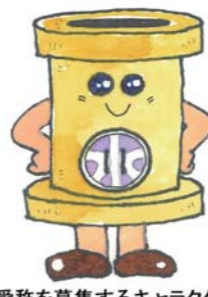
愛称を募集するキャラクター

毎年9月10日は「下水道の日」です。市では「下水道の日」行事の一環として、下水道事業のPRするキャラクターの愛称を募集します。採用された人には記念品を贈呈しますので、ぜひ応募ください。 ※採用された愛称について、著作権およびその他一切の権利は市に帰属するものとしま