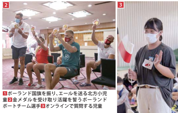
1ポーランド国旗を振り、エールを送る北方小児童 2金メダルを受け取り活躍を誓うポーランドボートチーム選手 3オンラインで質問する児童