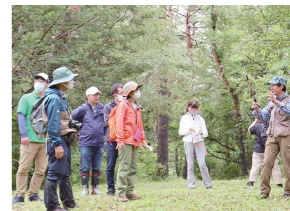
登米市から7人、気仙沼市から8人のガイドが参加。森林セラビロードなど市内の案内をしながら交流を深めました。

勉強会は、「おかえりモネ」の放送を機に両市のガイドが交流することで、連携しながら両地域の観光の活性化を図る取り組みとして実施。市内の観光施設などを見学した後、遠山之里で意見交換をしました。ガイドたちは「放送後のガイド方法の変化は」、「放送前と比べどのような観光客が増えたか」など、どのようなガイドの仕方が求められているのかを確認しました。