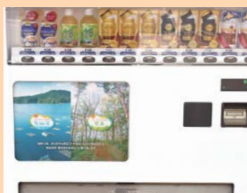
登米・気仙沼独自ロゴ 自販機を県内 300 台で展開

ポッカサッポロフード&ビバレッジ(以下、ポッカサッポロ社)が、県内に設置している約300台の自動販売機の広告表示部分(インナーパネル)などに、登米市と気仙沼市のポスターを展開しました。これは、ポッカサッポロ社が、NHKの連続テレビ小説「おかえりモネ」の舞台である両市を応援する取り組みとして実施したものです。登米、気仙沼の風景とロゴが使われたポスターを、自動販売機の広告表示部分や一部の量販店で展開しています。掲示期間は11月までを予定しており、市内では道の駅みなみかた「もっこのり」など5カ所に設置しています。