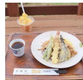
暑い季節は「海老天そば」や果実を丸ごと削ったかき氷「アイスカップ」がおすすめ

木製遊具があり、休日は親子連れでにぎわいます。 Q人気商品やおすすりめ商品などを教えてください 産直では、毎朝店内いっぱい採れたての新鮮な野菜が並びます。また、今の時期はカブトムシやクワガタ、駄菓子屋コーナーが子どもたちに好評です。