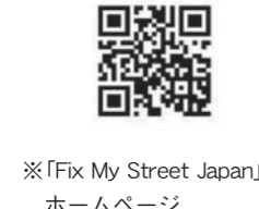
※「Fix My Street Japan」ホームページ