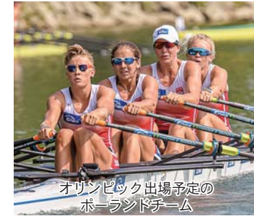
オリンピック出場予定のポーランドチーム

十分確保するなど、感染症対策を徹底して受け入れを支援します 【問い合わせ】東京オリンピック・パラリンピック推進室(教育部生涯学習課内) 0220(34)2698