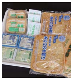
横綱が描かれたあらい食品の油揚げや小揚げ、納豆、絹ごし豆腐、木綿豆腐

第3代横綱丸山権太左衛門の出身地として、おすすめしたいのがあらい食品の油揚げなどの大豆食品です。パッケージには横綱のイラストが描かれており、横綱グッズと