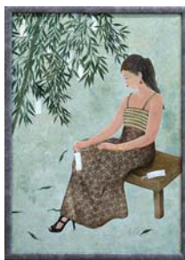
前回日本画の部 最優秀賞「短冊竹」

☎022(256)6512 FAX 022(256)6512 【部門】 日本画、洋画、書、写真、工芸 ※各部門1点まで