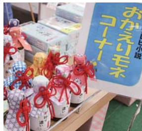
放送に合わせて、各種商品を取り揃えた「おかえりモネ特設コーナー」