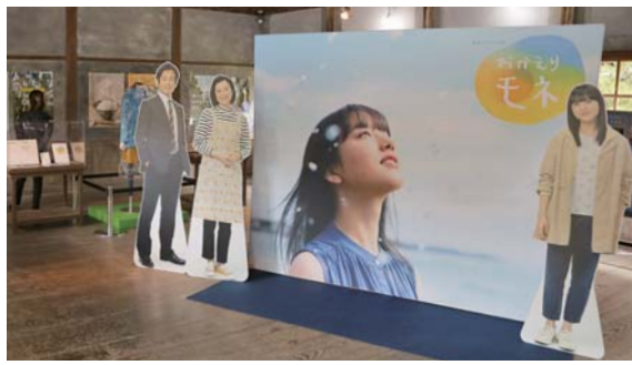
▲「おかえりモネ展」出演者等身大パネル展示 ▲「おかえりモネ展」モネ使用衣装展示