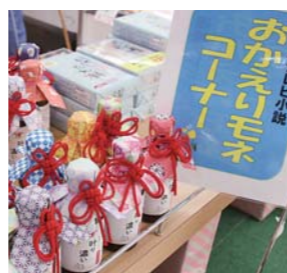
放送に合わせて、各種商品を取り揃えた「おかえりモネ特設コーナー」

しても楽しめます。 また、ヤマカノ醸造の焼肉のたれをはじめとした「おかえりモネ」の関連商品も続々と入荷していますので、放送と共に楽しんでください。 【問い合わせ】道の駅米山「ふる里センターY・Y」 0220(55)2747