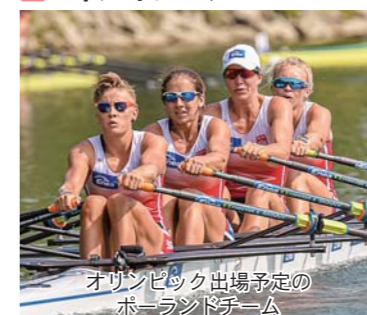
オリンピック出場予定のポーランドチーム

十分確保するなど、感染症対策を徹底して受け入れを支援します 【問い合わせ】東京オリンピック・パラリンピック推進室(教育部生涯学習課内) 0220(34)2698