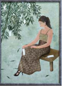
前回日本画の部 最優秀賞「短冊竹」

【部門】日本画、洋画、書写真、工芸 ※各部門1点まで 【テーマ】自由 【応募資格】県内在住で60歳以上のアマチュア 【出展料】1点につき500円 【申込期間】7月1日(木)～10月31日(日) 【展示場所】宮城県美術館(県民ギヤラリー) 【展示期間】12月2日(木)～5日(日) 【入場料】無料 ※優秀作品は「ねんりんピクカ」がわ2022「美術展部門」へ出展します