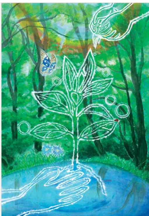
受賞作「育てよう緑の大地 つなげよう次の世代へ」

2004年6月17日、石越町第九在住。佐沼高等学校在学。2017年度第29回読書感想画中央コンクール入賞他、読書感想文や書きぞめなどで受賞歴多数。「想像だけの絵は限界がある」との考えから、現実の光の当たり方や影のつき方にこだわりを持ち、リアルさを追及する。かわいがっているセキセイインコは手乗りするほどに懐いている。