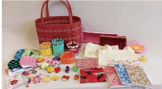
かごバッグやアクリルたわし、メモ帳、ビーズストラップなどを安価に販売しますので、ぜひお立ち寄りください。

7月28日(水)、8月27日(金)、9月28日(火)、10月28日(木)、11月29日(月)、12月20日(月)、令和4年1月28日(金)、2月28日(月)、3月28日(月) ※変更になる場合があります