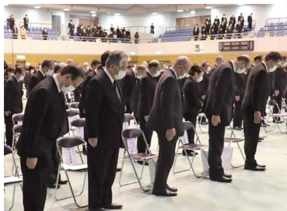
各追悼式は犠牲者の冥福を祈るとともに復興完遂を誓うため、震災後毎年執り行われています。

2011年3月11日午後2時46分に発生した地震により、30人の登米市民が亡くなったほか現在も3人が行方不明。負傷者は52人に及びました。建物被害は全壊201棟、大規模半壊441棟、半壊が1360棟。市では、震災を忘れず、今後も防災に取り組んでいきます。