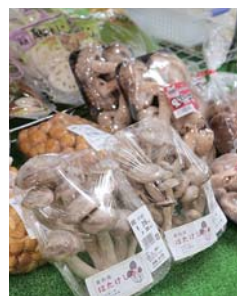
新鮮なキノコ類は栄養価が高く人気の商品