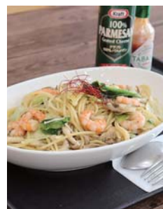
春のおすすめは「海老と菜の花のスパゲッティ」

レストランでは、季節限定のメニューが人気です。春限定のメニューは、チキンコンソメベースの味付けにエビや