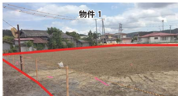
※赤線内が物件です。赤線は参考までにおおむねの土地の範囲を示したものであり、実際の境界とは異なる場合があります