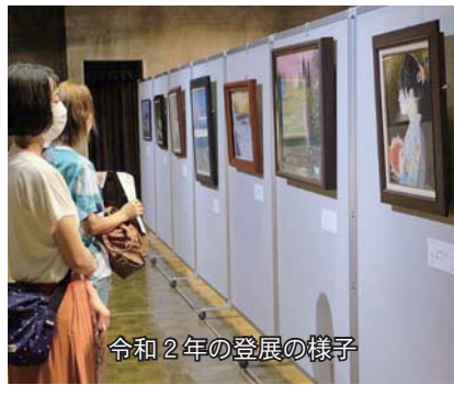
令和2年の展覧の様子

絵画愛好者の発掘や交流を目的とした「展覧」の展示作品を募集しています。絵画を愛する皆さんの作品を出展ください。