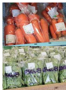
採れたての野菜が店内中に陳列されています