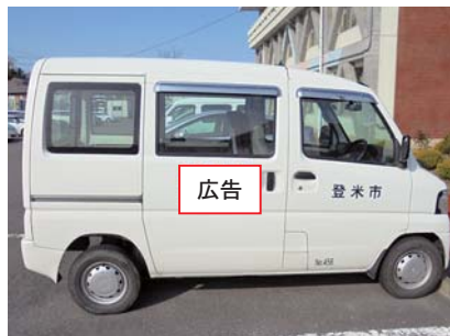
側面(後列両側ドア)