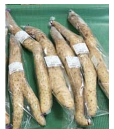
おすすめの豊里町産のナガイモは甘く、粘りが強いのが特徴

りゴボウは、皆さんから評判が良く、喜んでいただいています。4月中旬からトマトとキュウリ、5月頃からはキャベツなどがメインになります。地元の新鮮でおいしい野菜が店内に並びますので、ぜひお買い求めください。 【問い合わせ】豊里地域産物活用施設「産直がんばる館」 ☎0225(76)6201