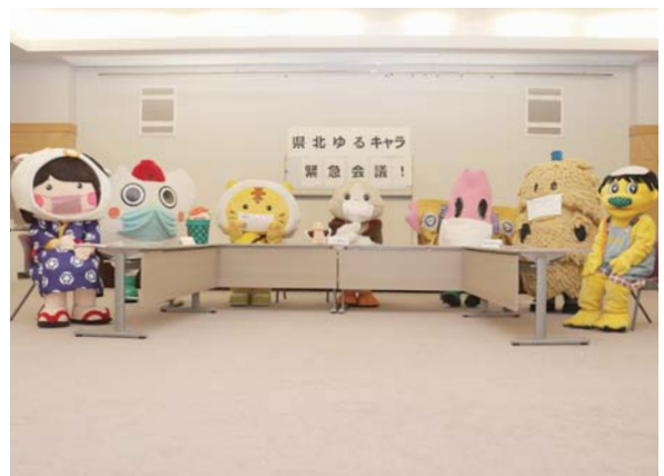
はっどん(左から2番目)は、郷土料理「はっと」について名前の由来などを紹介。紙に書いた発言をスタッフが読み上げました。

会議は「東北デスティネーションキャンペーン」(4月1日～9月30日)実施に先立ち、コロナ禍で観光客が減少している中、県北の魅力をどのようにPRできるのかを話し合うことが目的。マスク姿のゆるキャラたちが各地域の見どころを紹介し、より多くの人に届く情報発信の方法について話し合いました。また、イベント時の検温や三密を避ける工夫などのコロナ対策を盛り込んだ新しい観光に向けて意見が交わされました。