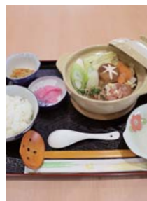
鶏からスープの鶏ちゃん こ鍋で身も心も温かに

この時期はリンゴやハウレンソウがおすすめ。他にもレンコン、ハクサイなど旬の野菜を取りそろえています。