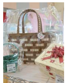
丁寧な編み込みのクラフト。収納の幅を広げます

園内にはキャンペーン場があり、「電源付き区画オートサイト」「芝生広場サイト」「一般フリーサイト」の3タイプから選べます。電源付きサイトと芝生広場サイトはスタンブカードの特典があります。特に電源付きサイトは、スタンブを5つ貯めるとサイト料が無料になるため、リピーターが大幅に増えました。事前に電話で予約ください。 【問い合わせ】 長沼フートピア公園 ☎0220(22)7600