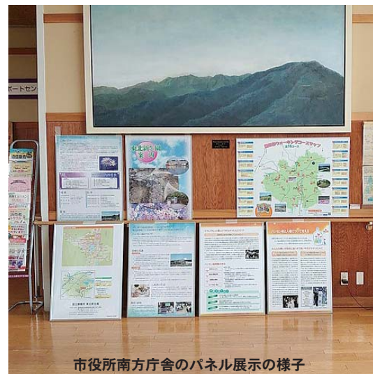
市役所南方庁舎のパネル展示の様子