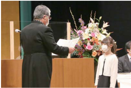
【表彰式】11月3日(火) 【場所】登米祝祭劇場