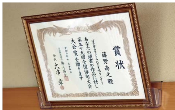
大会賞の賞状。例年であれば授賞式が東京で催されるが、今回は新型コロナウイルス感染症の影響で中止になった。

1936年12月14日、迫町光ヶ丘東生まれ、84歳。会社を定年後、65歳で俳句結社「かたばみ」(埼玉県大宮市)、その3年後に「きたごち」(仙台市太白区)に入会。現在は、文化・スポーツクラブはさまで月1回開催される俳句教室で講師を務める。趣味は釣り、ゴルフ、囲碁。