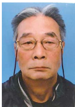
東京迫会幹事 迫町(五日町)出身