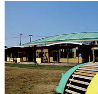
令和2年4月1日に開園した「つやま杉の子こども園」

【申込方法】申込書などの必要書類を、1号認定の人は入園希望施設に、2、3号認定の人は各総合支所市民課(市民係)に提出してください