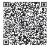
台風災害タイムラインQRコード