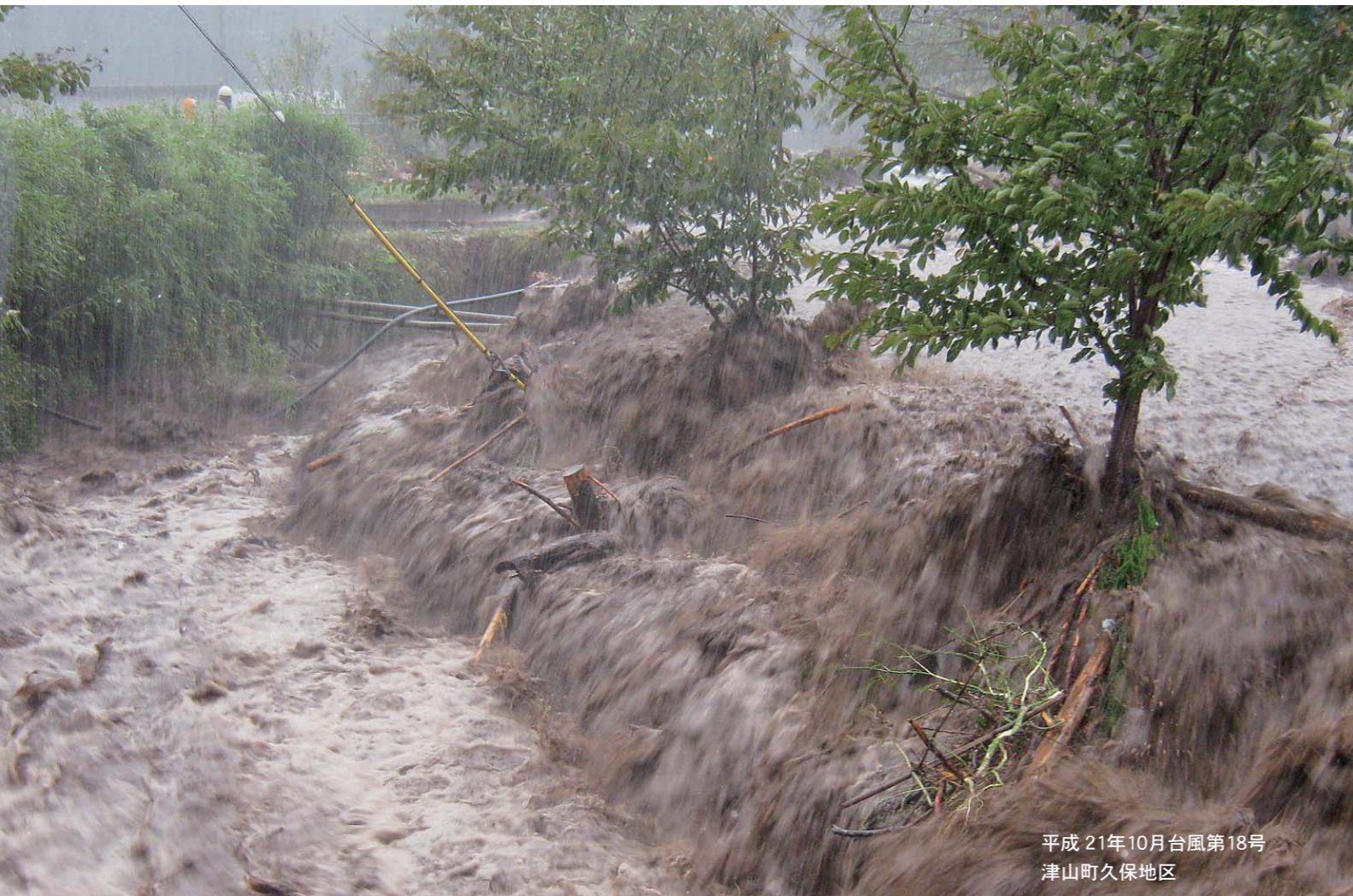
平成 21年10月台風第18号 津山町久保地区