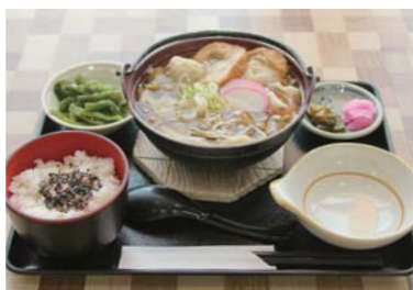
はっとフェスティバルでグランプリ大賞に輝いたことがあるはっと汁をベースにした「はっと定食」(680円)

三陸自動車道が南三陸町まで延びたことで車の流れが変わり、これまでのロードサイドの休憩所としての施設から目的地として来なくなる施設を目指して営業しています。観光目的はもちろん、日常の買い物のために遠くまで運転するのが大変という地元の声にも応え、日用品、精肉や調味料なども充実させ、地元根付いた店としても力を入れ