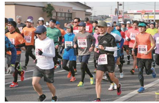
12月6日に予定していた「第35回カップパーハーフマラソン」

【日時】8月30日(日)午後0時45分～3時20分 【場所】石巻高等技術専門学校 【内容】自動車整備科、金属加工科、木工科の内容説明、校内見学、体験実習 ※軽作業に適した服装と運動靴でお越しください 【問い合わせ】石巻高等技術専門学校 ☎ 0225(22)1719 ● 市職員試験(初級)の日程を変更します