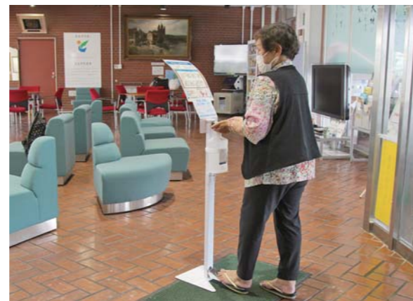
除菌アルコールスタンドは足踏み式でハンズフリーのため、衛生的。感染症予防対策として各総合支所入口に配置しています。