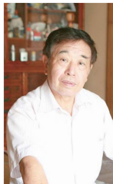
津山町横山9区自主防災組織代表