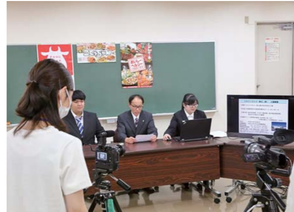
収録した動画は、DVDにして市内や近隣の高等学校へ配布するほか、市公式ホームページに掲載します。

就職ガイダンスは、学生の就職支援と若者の定住促進を目的に学生や保護者、一般求職者、UIターン就職希望者を対象に毎年開催。本年度は新型コロナウイルス感染症拡大防止のため、対面での説明ではなく、各企業が会社概要などを紹介する動画をDVDに収録し、配布することにしました。企業の人事担当者などは、カメラに向かい会社の特徴や取り扱っている製品、一日の仕事の流れなどを工夫しながら説明していました。