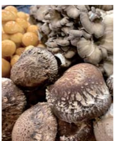
シイタケ、マイタケなどのキノコも人気の

レストランはランチ目的のお客さまも多く、おいしいと評判です。はっと定食は不動の人気メニュー。ほかにも季節