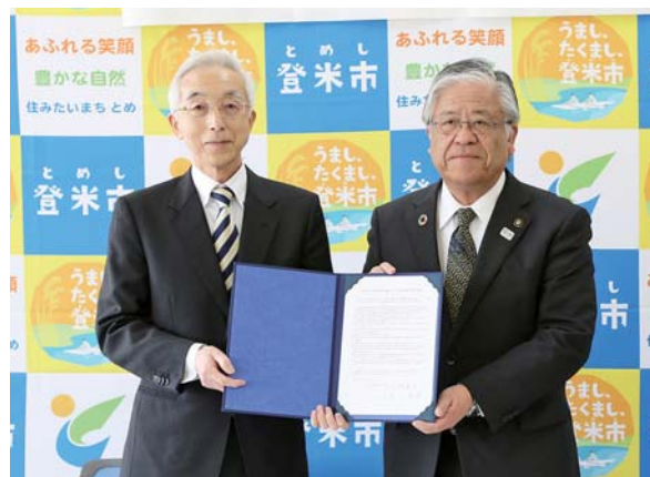
放送番組を記録したDVDは、6コース100科目を超える内容のものを配置する予定です。

放送大学は、全国約9万人の学生が在籍する通信制の大学。覚書を締結したことで、登米市と近隣の在学学生が中田生涯学習センターでDVDを使った学習ができるほか、在学生でなくても体験学習としてDVDを視聴できるようになります。大淵所長は「締結を機に、在学生の勉学向上と近隣住民の生涯学習につながることを願っています」と期待を寄せました。