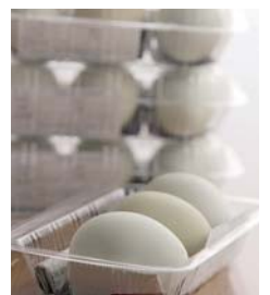
アロウカナの卵。3個で220円(税込み)。店長おすすめのお食べ方は、卵かけごはん。