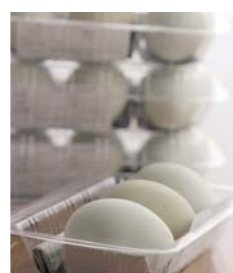
アロウカナの卵。3個で220円(税込み)。店長おすすめの食べ方は、卵かけごはん。

は玄関や床の間に生けていた。そのせいか、私も気忙しい日々の生活の中、細やかな花器に花が野にあるように生けて楽しんでる。 小学生の頃、祖母に連れられ、田んぼ道にあった土筆やヨモギ、フキノトウなどを籠いっぱい摘んだ。それらは朝露に濡れ、新鮮そのもの。摘草の持ち味であるぬめり、苦み、酸味を生かし、きな粉と砂糖をたっぷりかけた草餅やフキノトウのつくいだ煮、天ぷら、おひたしなどを作って食べさせてもらった。懐かしい古里の味、祖母の味である。 そんな春の和やかな行楽風景も、なぜか今では目にする事はなくなった。寂しい限りである。しかし、私の心の中では古里の春を告げる花や摘草への郷愁は枯れることなく深く生き続けている。 今年母の七回忌。佐沼に住んでいるいとこ夫婦、仙台と東京に住んでいる兄夫婦と共に素朴でふんわかとした餅を食べながら、昔話に花を咲かせたい。その頃、佐沼中学校の隣にある墓地にはどんな花が咲いているのだろうか。祖母や両親が好きだった野の花をいっぱい墓前に供えてあげたいと思っている。