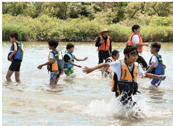
いかだを止めて、浅瀬で水遊びを楽しむ子どもたち。自然との触れ合いを存分に楽しんだ1日でした。

川遊び体験は、同事務所の地域活動プログラム開発事業の一環で、子どもたちの生きる力を育むことが目的。脇谷洗堰閘門から植立山河川公園までの約3 キロ のコースを、全長約40 メートル の巨大いかだに乗り、川下りを楽しみました。途中で川に入り、カヌー、水上自転車や発泡スチロールなどに乗り換えて川を散策。子どもたちは、普段できない川遊びにとっても生き生きとした表情を見せていました。