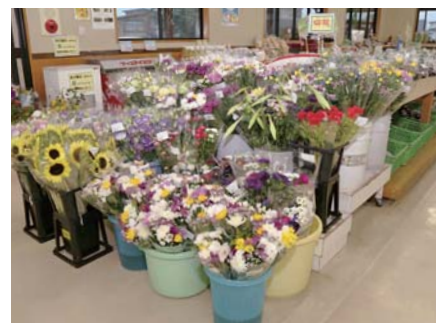
季節ごとに変わる彩り豊かな切り花も人気です

10月28、29の両日、「収穫感謝祭」を開催します。新米やリンゴなどが当たるお楽し