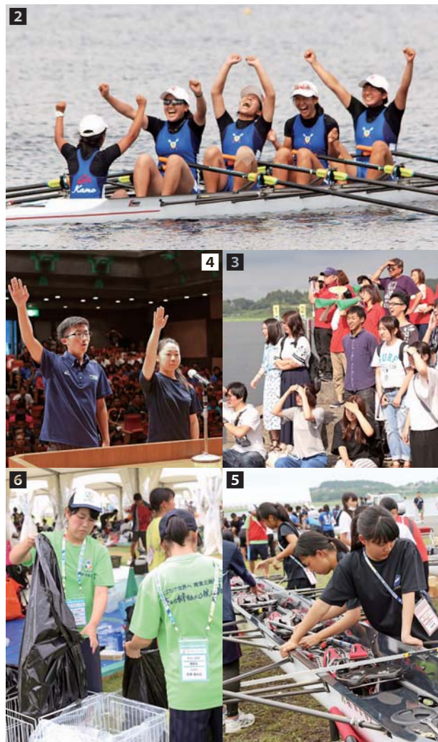
1 4日間、約千人の選手が聖地長沼で熱戦を繰り広げた 2 優勝を決め、喜びの感情を爆発させる加茂高女子クルー 3 大会期間中、約5千人の観衆が訪れ、クルーらに声援を送った 4 熱い戦いを誓った選手宣誓 5 リング場でボートを整備する選手ら。スペースに余裕があり、関係者からは好評を得た 6 準備から後片付けまで、市内外の高校生が大会を支えた