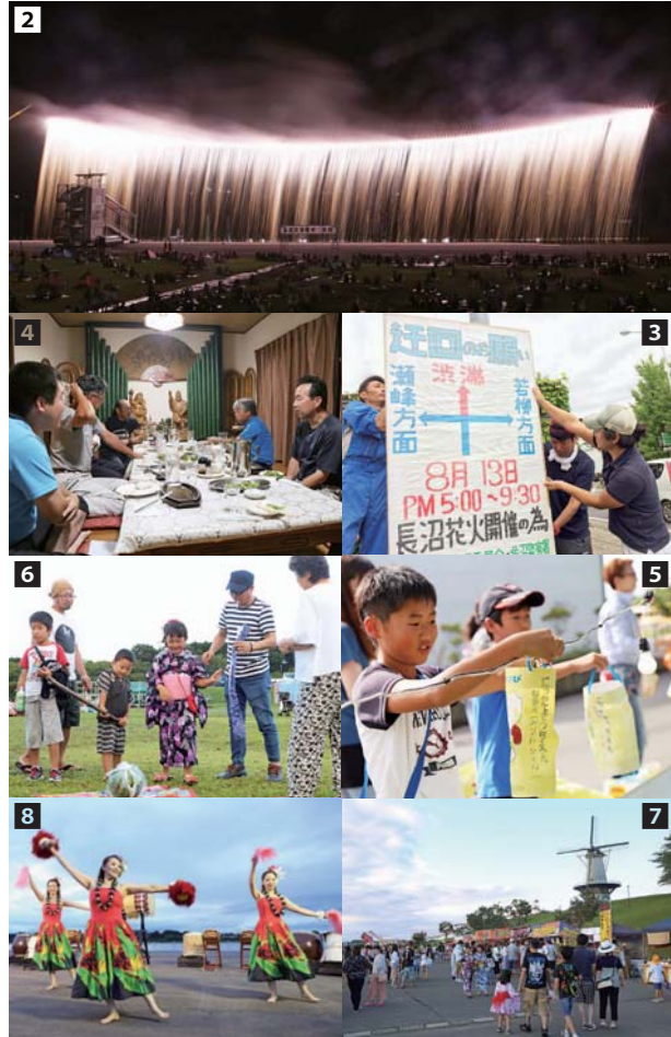
1 水中スターマインが見られる花火大会は、市内で長沼だけ 2 2000年から始まった名物「ナイアガラ」。今年の全長は159m 3 看板の設置などは、7月中旬に準備する 4 相談役となった初期メンバーから意見を聴く 5 打ち上げ会場付近の灯籠は、エスペランサ登米FCの子どもたちが設置に協力 6 花火会場は、家族連れでバーベキューやスイカ割りなどを楽しむ姿が見られた。花火会場内でバーベキューをできるのは、県内では長沼だけ 7 フートピア公園駐車場には屋台などが並び、多くの家族連れでにぎわう 8 花火打ち上げ前は、フラダンスや太鼓などが披露

を開催しました。一発目の花火が上がったときは、涙が流れました。「花火は、今回だけ」と話すと、手伝いに来た迫町青年会員が引き継いでくれました。歴代実行委員のお陰で「おらいの花火」がここまでつながってきました。感謝しています。