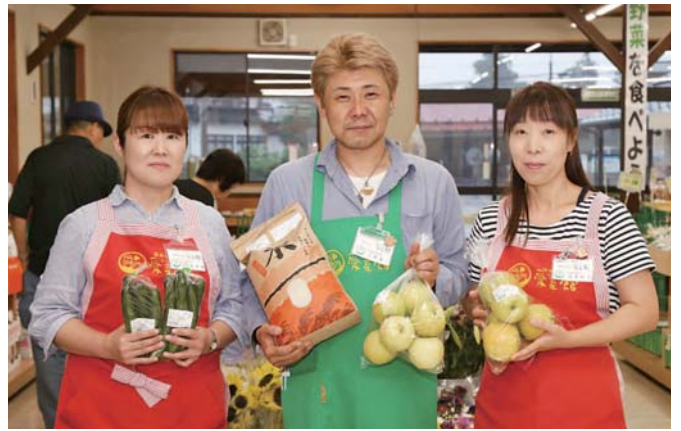
「いつでも新鮮で安全な野菜や米を豊富に取りそろえています」と笑顔で迎えてくれるスタッフの皆さん