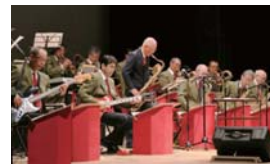
記念コンサートでの力強く優しい演奏に観客たちは酔いしれる

市内で活躍するアマチュアバンド「ニュー・シャーマン楽団」が、今年結成40周年を迎えた。記念コンサートは6月18日、登米祝祭劇場で開かれ、老若男女を問わず、幅広い年齢層の観客で会場は埋め尽くされた。