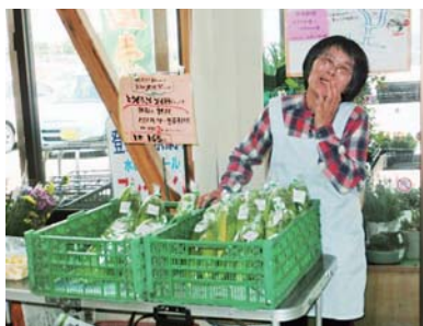
生産者自ら商品を販売する「ひとくち会」。「皆さん、寄って下さいね」