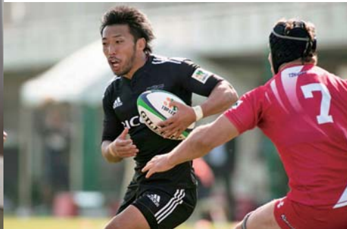
取材協力：リコーブラックラムズ

profile 1984年9月27日、迫町茂栗生まれ。東京都世田谷区在住。新田一小(現新田小)、中時代は、野球で活躍。佐沼高入学後、姉や中学時代の恩師などの勧めでラグビーの道へ。2003年立正大学へ進学。07年株式会社リコーに入社し、リコーブラックラムズへ入部。10年に社員からプロ選手へ転向。173㎝、85㎏。