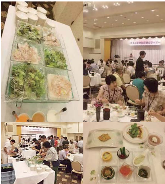
生産者が、心を込めて作った野菜などを使った料理が皆さんをお待ちしています。

【申し込み・問い合わせ】登米市のうまいもん！発見の旅事務局（産業経済部産業政策課内） ☎0220（34）2491