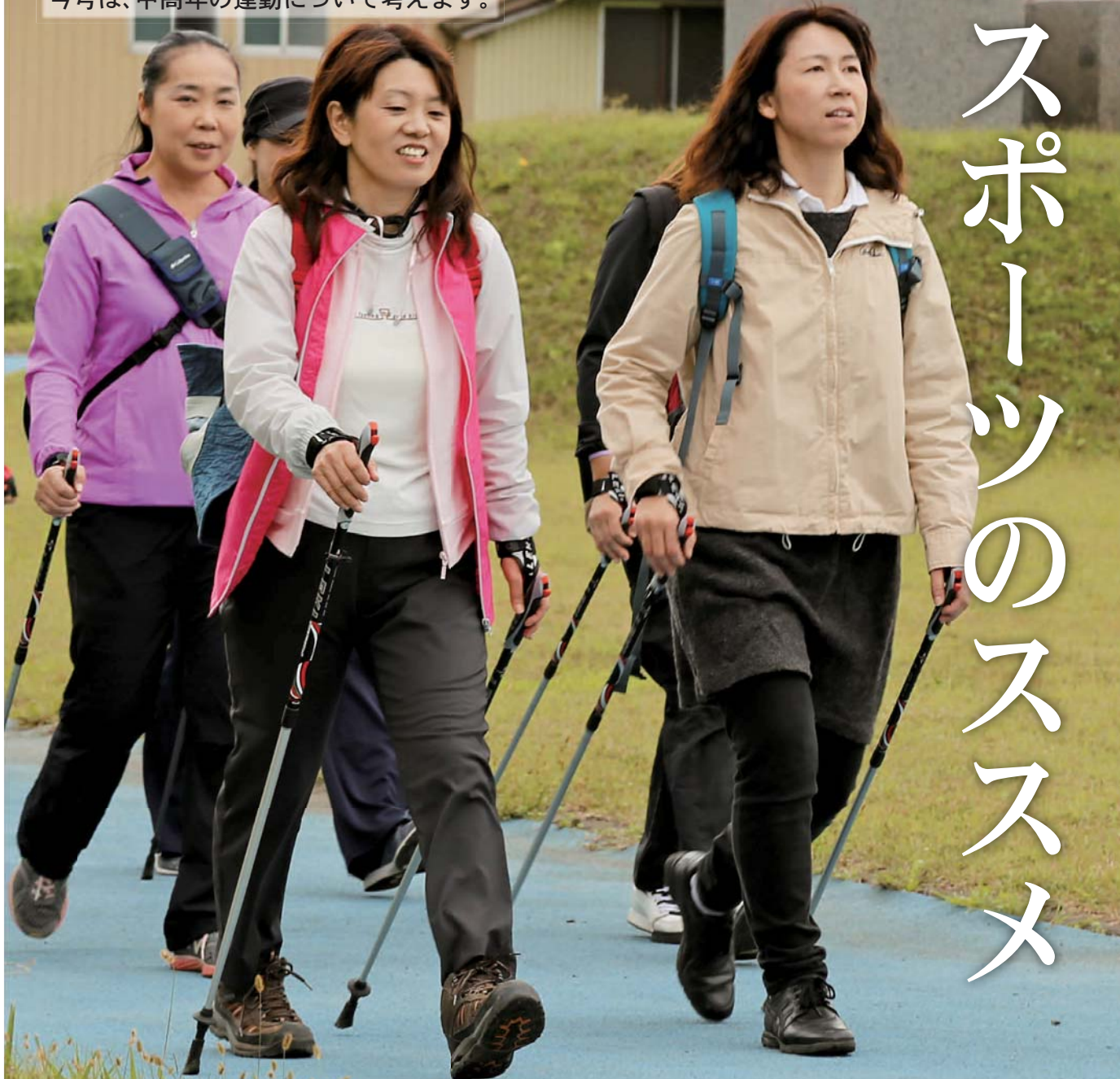
◆登米市の健康寿命と平均寿命