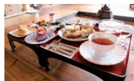
お膳に載って運ばれてくる手づくりのケーキや紅茶のセットメニュー

2016年に東和町錦織で「古民家カフェ甘欧」を開店し、自家製ケーキや焙煎したコーヒーなどを提供。ピザやソーセージづくり、家畜とのふれあい体験や民泊も受け入れている。