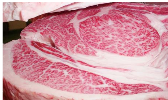
名誉賞を受賞した川口ファームの出品牛