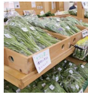
年間を通じて数多くの野菜を販売。冬は新鮮な葉物野菜が並びます。

「新鮮な野菜、農産加工品、ふわっとしたやわらかさが特徴のぶどうパン、レストランの総菜やご飯など、おいしいものがたくさんあります」と話すスタッフの皆さん。