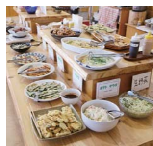
ランチバイキングは1100円でたぐさんの総菜が楽しめると連日盛況。

す。野菜の中でも、特に人気があるのがニラ。南方町のニラは「もっこりニラ」の愛称で知られ、肉厚でやわらかく、甘みがあるのが特徴です。 また、今の時期は干し柿が人気です。最近では軒先で干し柿を作る風景が少なくなってきましたが、もっちりした食感で甘みが口の中いっぱい広がります。餅も根強い人気があります。予約があれば、祝い餅や供養餅も作ります。 レストラン野の花では、10月からポイント券を発行しています。お食事千円ごとに1