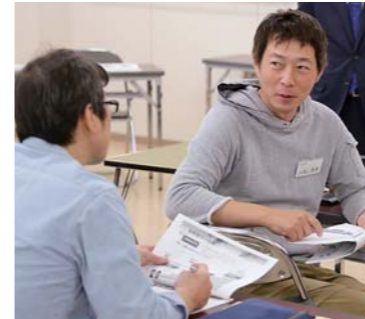
創業チャレンジセミナーでは、参加者が考えを共有し、互いの意見を参考にしながら学ぶ 登米中央商工会 ☎0220(22)3681 みやぎ北上商工会 ☎0220(34)3255 登米みなみ商工会 ☎0220(55)2331