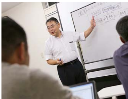
10月8日にコンテナおおあみが開催した創業スタートアップセミナー。一人一人の事業モデルを参加者全員で検討