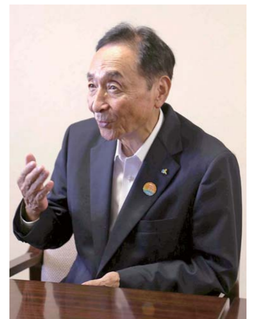
市教育委員会 高橋 富男教育長(67)