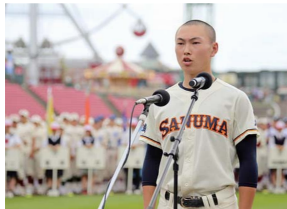
選手宣誓する千葉主将。高校球児らしい力強い声を球場全体に響かせ、会場からは大きな拍手が送られました。

選手宣誓は、組み合わせ抽選会で立候補した44チームの中から抽選で決定。開会式で千葉主将は「平成から令和へ、新しい時代の幕開けの大会に臨めることを誇りに思う。支えてくれた人たちや応援してくれる人たちに感謝の気持ちを込めて全力でプレーし、たくさんの笑顔の花を咲かせる」と宣誓。仲間たちと令和最初の夏を精いっぱい戦い抜くことを誓いました。