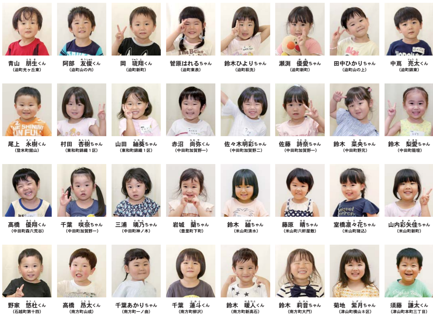
むし歯がなかった子は、市内9地区で37人中32人でした