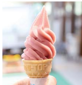
ソフトクリームは300円。ミニサイズは220円で販売しています

新発売の「水かぶりマフィン」(350円)。マフィンに振りかけられた刻んだココナッツは、米川の水かぶりて男たちが身につけるしめ縄装束をイメージしています。