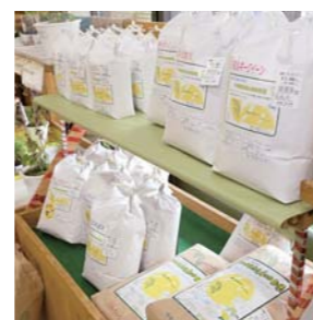
東和町産の多品種の新米を販売します。お楽しみに

す。しつとりした食感で、ちょうどいい甘さのクリームが入っているのが特徴です。クリームは、くるみ味とずんだ味の2種類あります。また、今の時期はソフトクリームがお勧めです。中でも、東北でここぞしか買うことのできない、新感覚「濃厚梅干し味」の男梅ソフトクリームは、爽やかな酸味があり甘さ控えめなので、男性にとっても人気があります。 Q これから開催されるイベントなどを教えてください A 9月下旬には、いよいよ新米の販売が始まります。販売