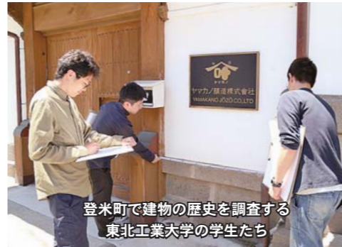
登米町で建物の歴史を調査する東北工業大学の学生たち

【申込方法】電話、ファクシミリ、電子メールのいずれかで申し込みください ※ファクシミリ、電子メールの場合は、住所、氏名、電話番号を記入し、「9月19日開催市民向け公開講座参加希望」と明記してください ※第2回公開講座は10月下旬に津山町内で開催予定です 【申し込み・問い合わせ】産業経済部産業連携推進課(産業連携係) ☎0220(34)2549 FAX0220(34)2802 ✉sangyorenkei@city.toyama-yagi.jp