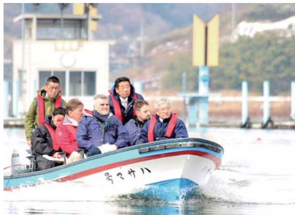
長沼ボート場を視察するポーランドボート協会の視察団。選手たちにとって良い環境だと話していました。

同協会は、事前合宿地を検討するため、今年3月31日から4月1日まで、市内の施設を視察。長沼ボート場のほかに国内3カ所のボート場も候補地に含まれていましたが、2千メートル8レーンのコースと水の流れが穏やかで、波が少ない環境が決め手となりました。合宿は、来年7月10日から20日までの予定で、長沼ボート場やクラブハウスなどでトレーニングを実施します。