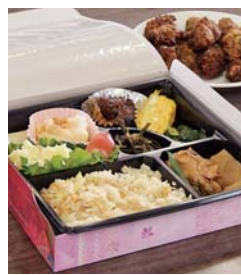
手作りのお弁当は、野菜がたっぷり入って栄養満点。1個500円

総菜も人気商品で、オープン当時から不動の人気を誇るの、みそ、小麦粉、砂糖などを混ぜ、油で揚げた「みそやき」。誰でも作れるようにレシピを店内に掲示していますが「なかなかこの味にならない