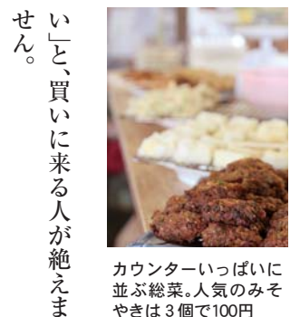
カウンターいっぱいに並ぶ総菜。人気のみそやきは3個で100円